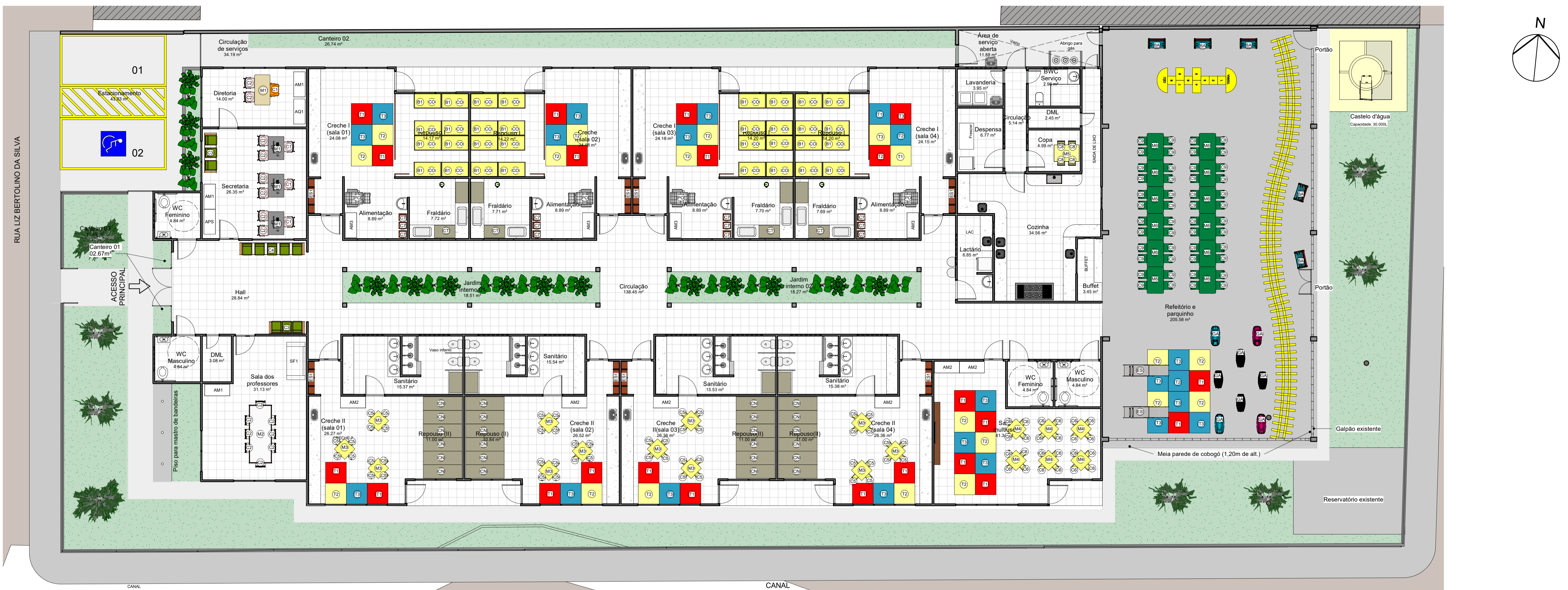
1 Planta Baixa Layout ESCALA 1 : 100