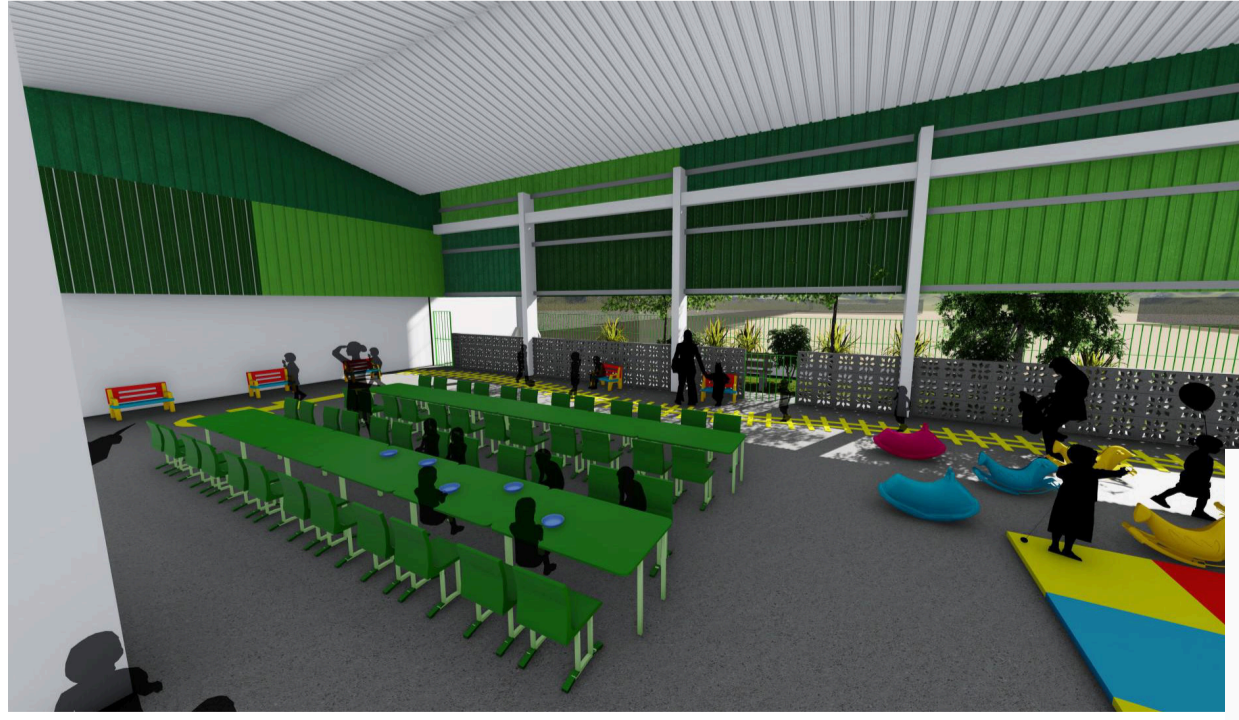
7 Perspectiva Refeitório e Parquinho Sem escala

DESCRIÇÃO: Projeto arquitetônico para creche (público infantil de 0-2anos), com base no dimensionamento do FNDE. Localizada na Rua José Ferreira da Silva, esquina com a Rua Luiz Bertolino da Silva, bairro Antão, município de Toritama-PE.