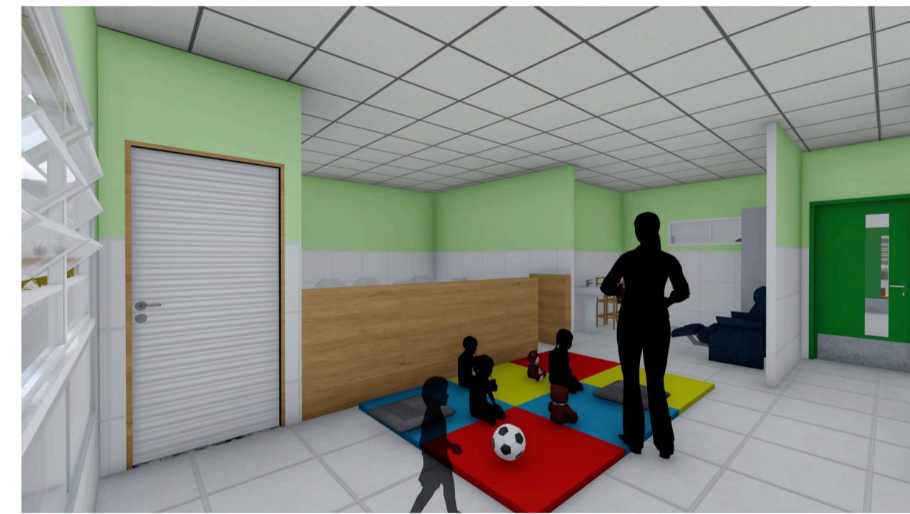
4 Perspectiva Creche I Sem escala