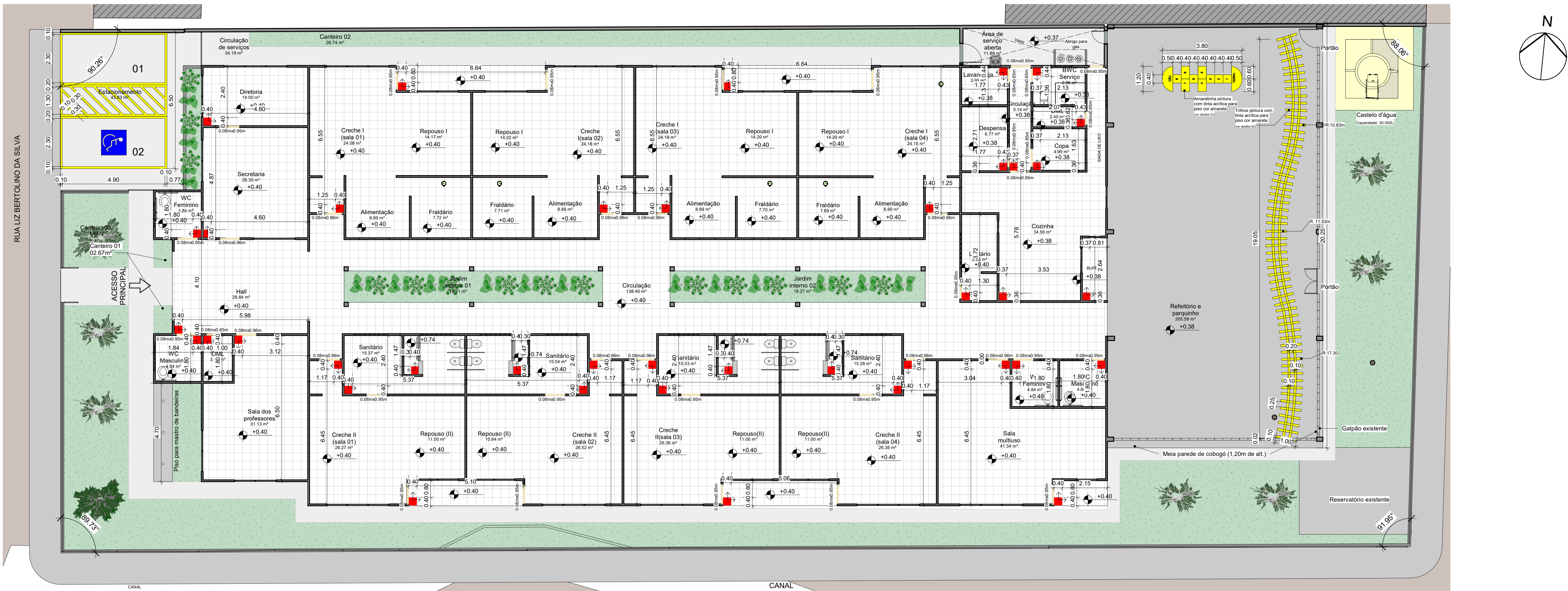
1 Planta Baixa - Paginação de Piso ESCALA 1:100

LEGENDA ■ Início do assentamento do piso □ Piso cerâmico branco 40x40cm ou similar → Sentido do assentamento — Soleira em granito cinza Andorinha