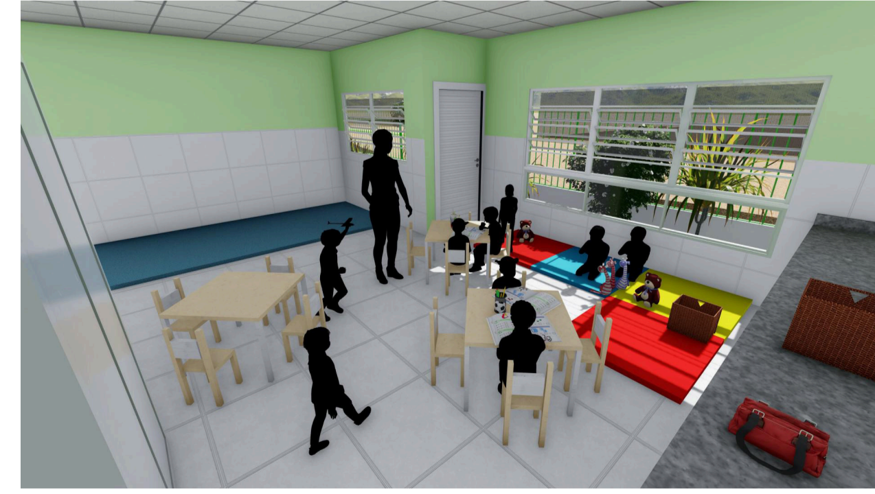
6 Perspectiva Creche II Sem escala