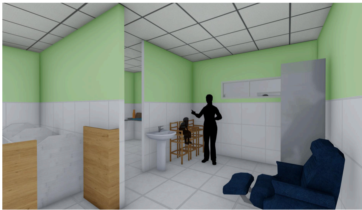
5 Perspectiva Creche I Alimentação e Repouso Sem escala