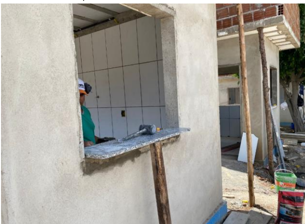
FOTO - 37 Quiosques