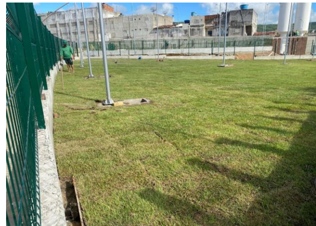
FOTO -4 INFRAESTRUTURA GERAL - Grama e gradil da área PET'S