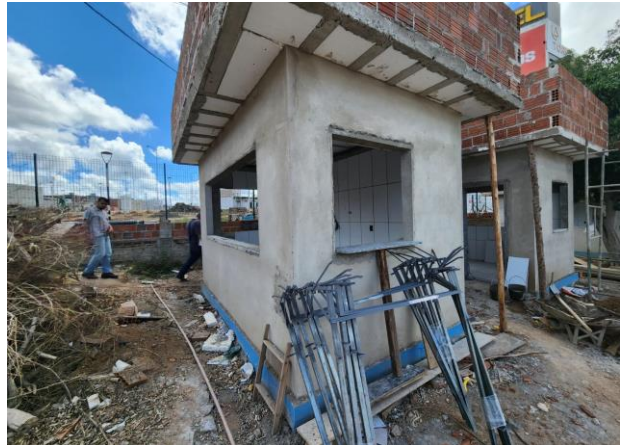
FOTO - 42 Quiosques