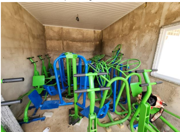
FOTO - 11 Equipamentos - musculação/academia