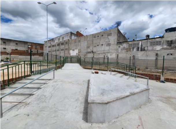
FOTO -1 INFRAESTRUTURA GERAL - Instalações elétrica