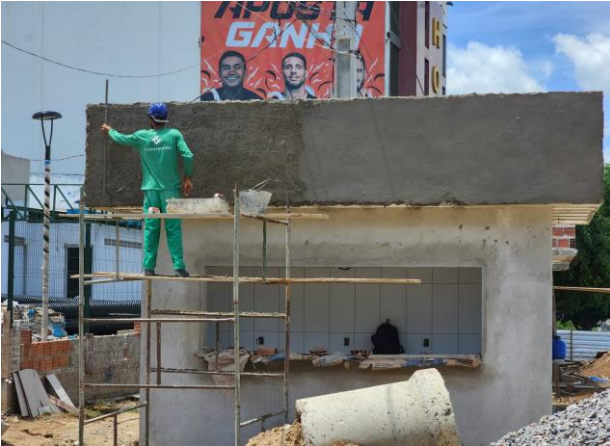
FOTO - 33 Quiosques