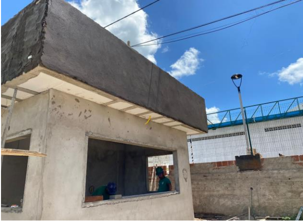
FOTO - 39 Quiosques