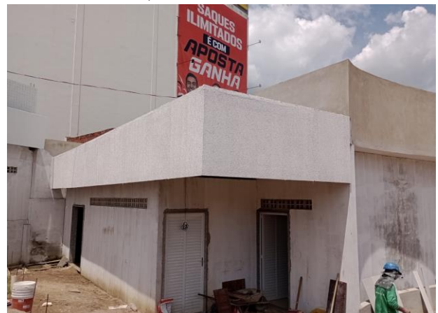
FOTO - 16 Banheiro da área de piquenique