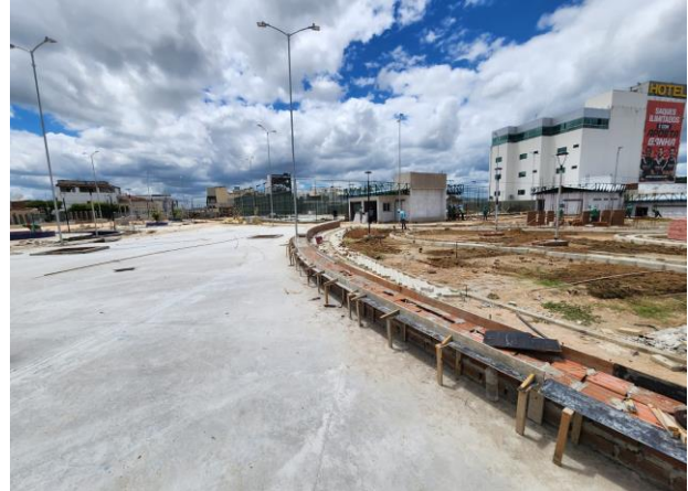
FOTO -2 INFRAESTRUTURA GERAL - Instalações elétrica