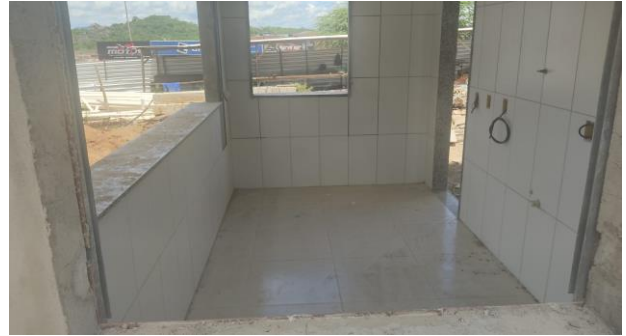
FOTO - 34 Quiosques