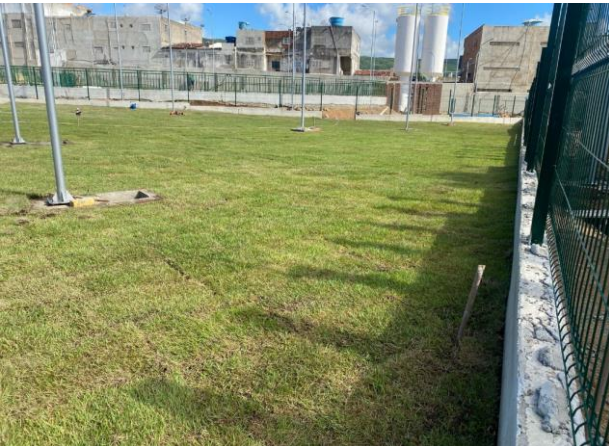
FOTO -3 INFRAESTRUTURA GERAL - Grama e gradil da área PET'S