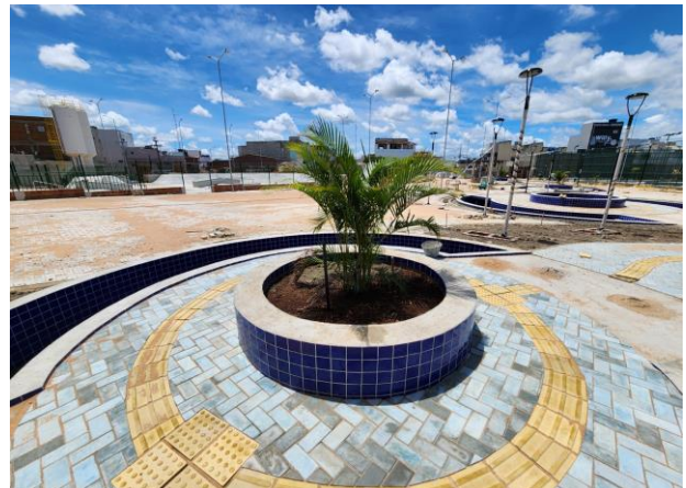
FOTO - 10 Piso tátil - espelhos d' água