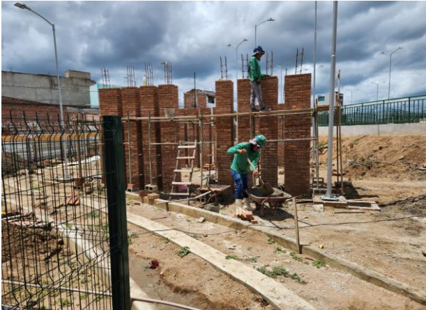
FOTO - 7 Gazebos