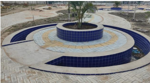
FOTO - 9 Piso tátil - espelhos d' água