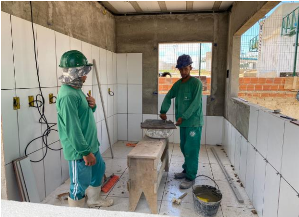
FOTO - 41 Quiosques