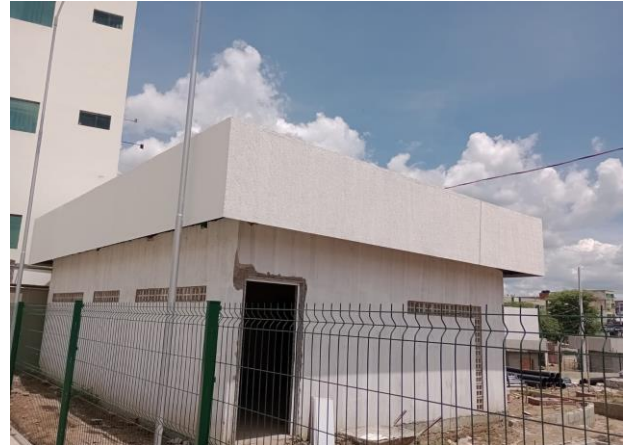
FOTO - 22 Alojamento