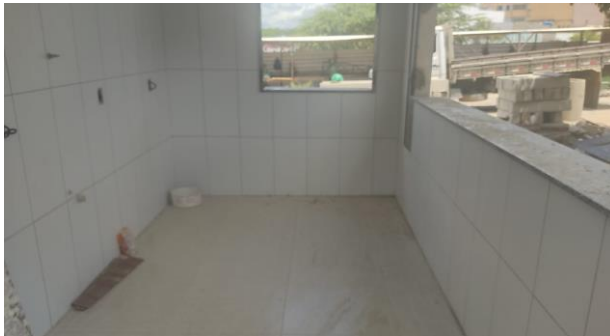
FOTO - 35 Quiosques