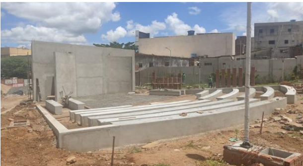
FOTO - 27 Teatro