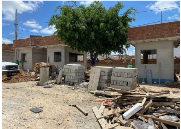
FOTO - 40 Quiosques