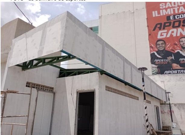
FOTO - 17 Banheiro da área de piquenique