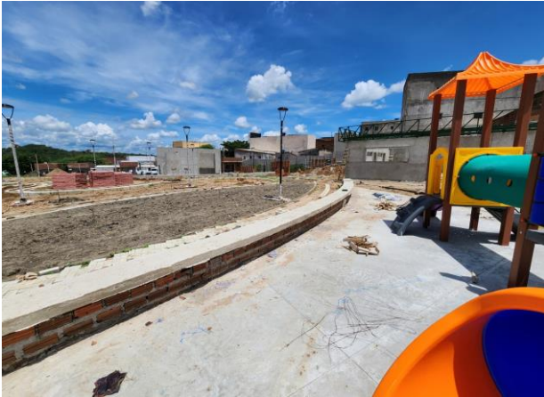
FOTO - 19 Playground