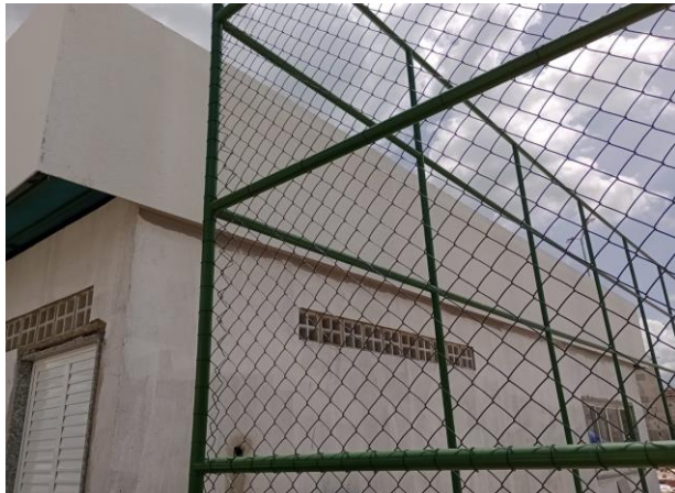
FOTO - 15 Banheiro de esportes