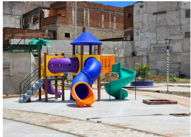
FOTO - 20 Playground