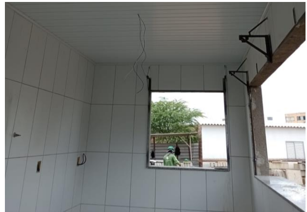
FOTO - 36 Quiosques