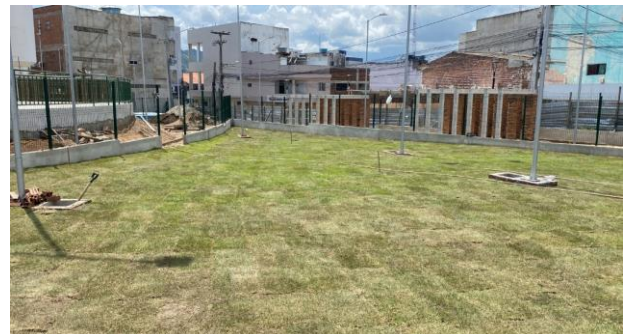
FOTO -6 INFRAESTRUTURA GERAL - Grama e gradil da área PET'S