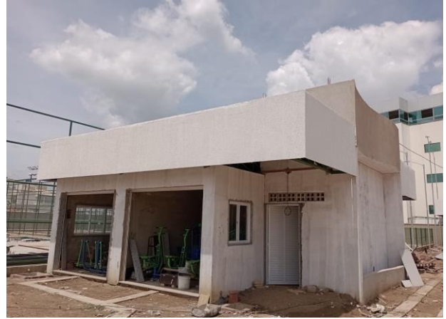
FOTO - 14 Banheiro de esportes