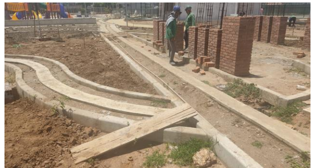
FOTO - 8 Gazebos