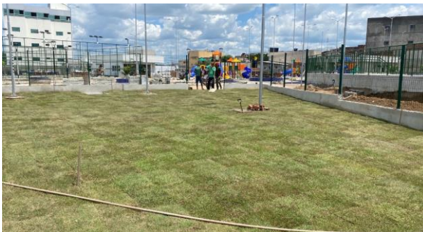
FOTO -5 INFRAESTRUTURA GERAL - Grama e gradil da área PET'S