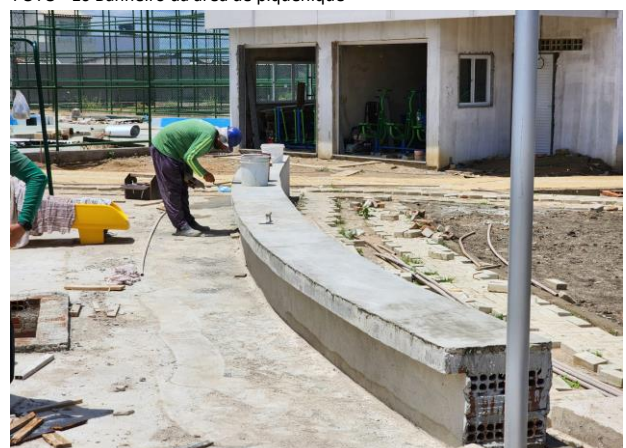
FOTO - 18 Playground