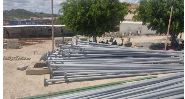
FOTO - 20 Área de Piquenique - Postes e luminárias