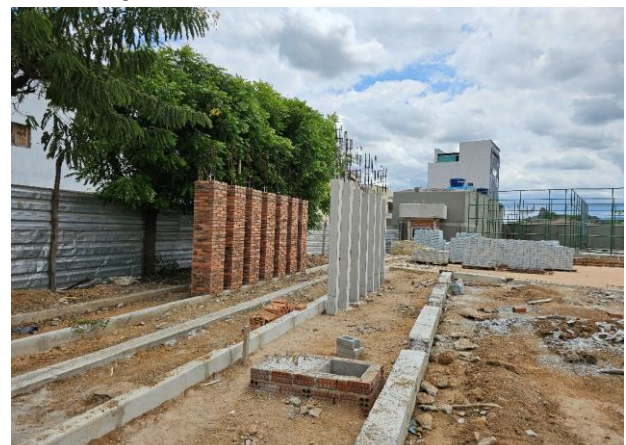
FOTO - 36 Pergolados