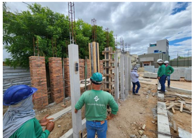
FOTO - 34 Pergolados