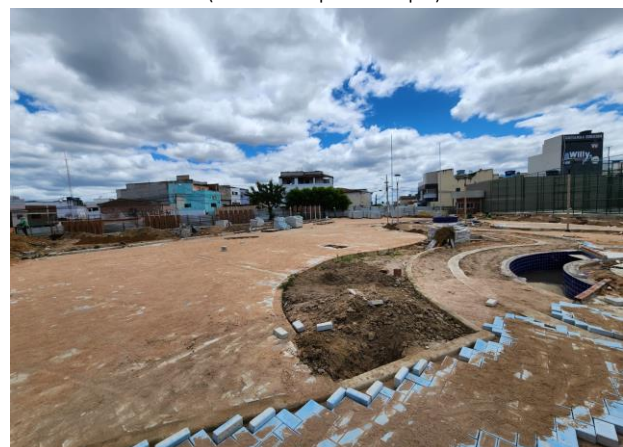
FOTO - 12 Área de Eventos e espelhos d'água