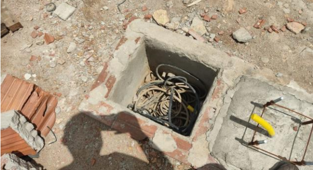
FOTO -1 INFRAESTRUTURA GERAL - Instalações elétrica