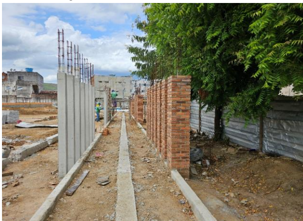
FOTO - 35 Pergolados