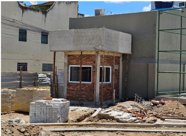
FOTO - 15 GUARITA - Esquadrias