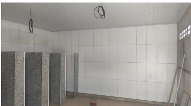
FOTO - 17 Banheiros da área de Piquenique - Forro de PVC