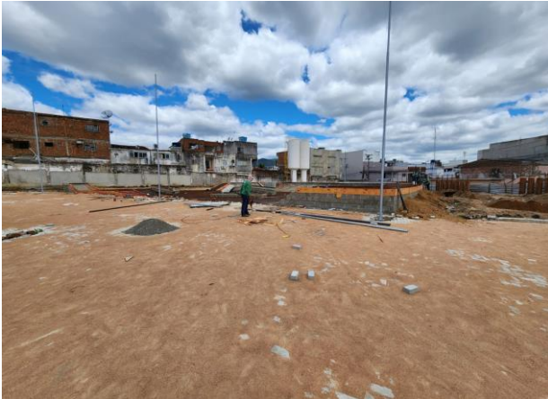
FOTO - 13 Área de Eventos e espelhos d'água