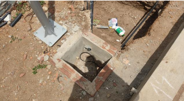
FOTO -3 INFRAESTRUTURA GERAL - Instalações elétrica