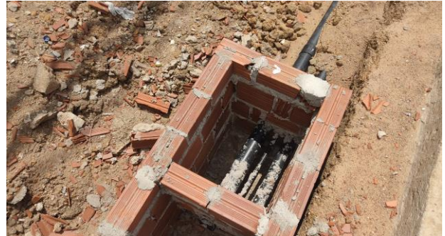
FOTO -2 INFRAESTRUTURA GERAL - Instalações elétrica