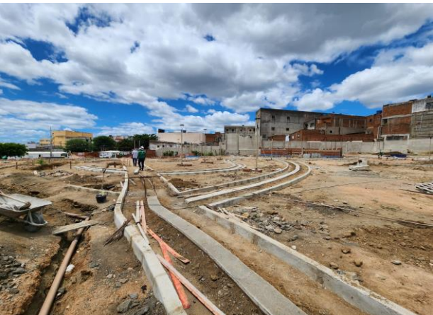
FOTO -5 INFRAESTRUTURA GERAL - Instalações Hidráulica geral