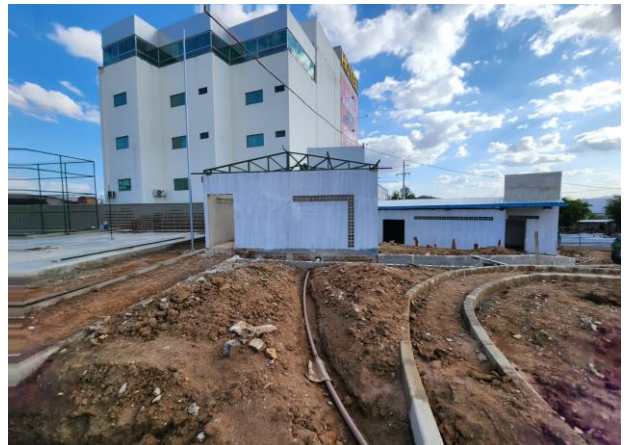
FOTO -6 INFRAESTRUTURA GERAL - Instalações Hidráulica geral