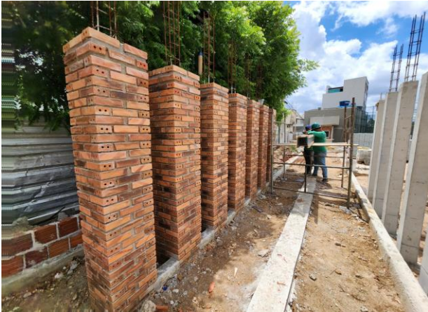
FOTO - 31 Pergolados