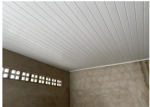
FOTO - 16 Banheiros da área de Piquenique - Forro de PVC