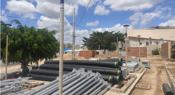
FOTO - 19 Área de Piquenique - Postes e luminárias