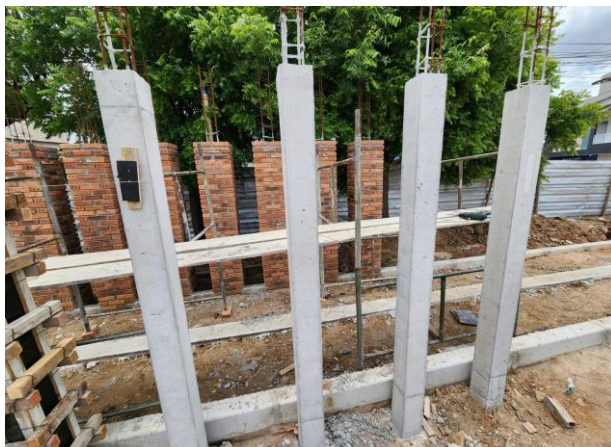
FOTO - 33 Pergolados