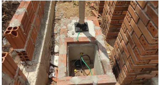
FOTO -4 INFRAESTRUTURA GERAL - Instalações elétrica