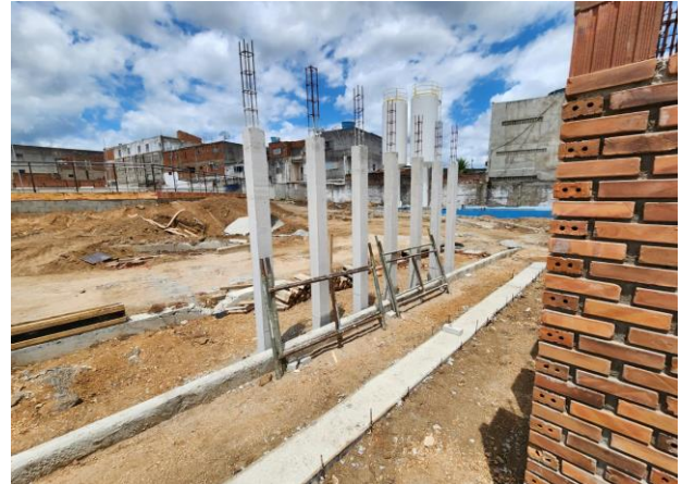
FOTO - 32 Pergolados