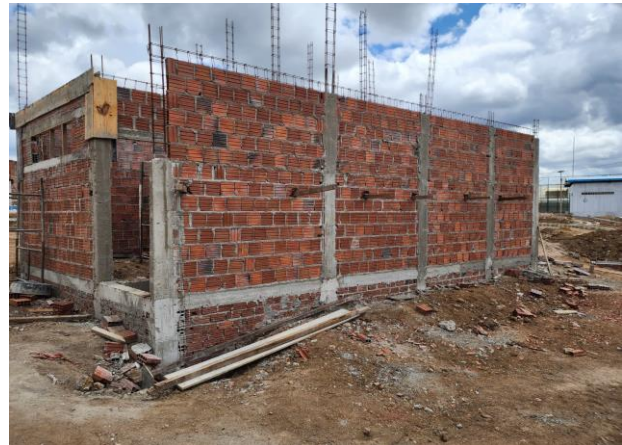
FOTO - 26 Camarins