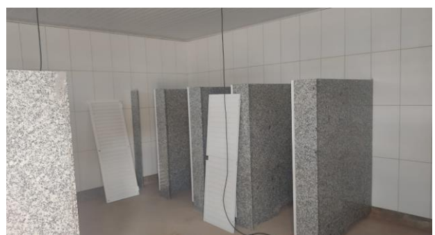
FOTO - 18 Banheiros da área de Piquenique - Forro de PVC