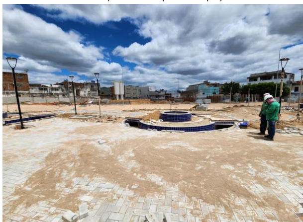
FOTO - 11 Área de Eventos e espelhos d'água