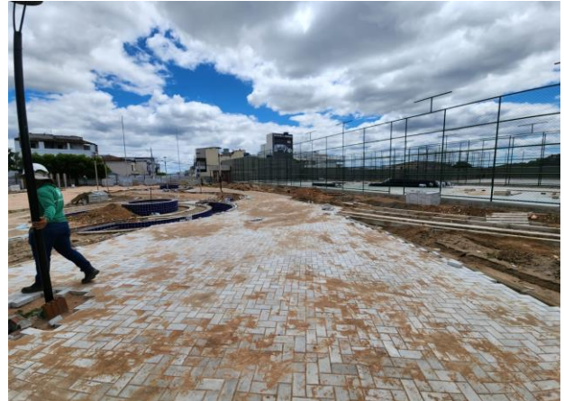
FOTO - 14 Área de Eventos e espelhos d'água