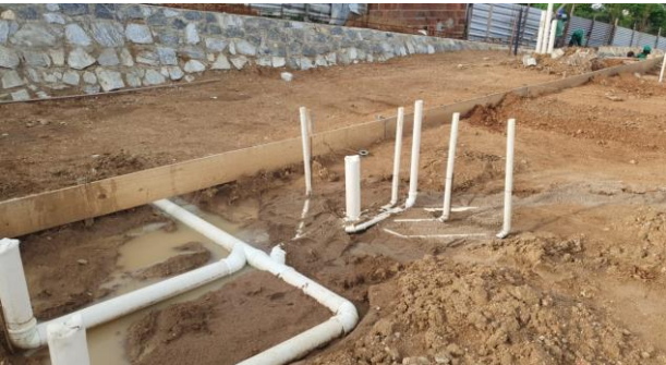
Instalações Sanitárias da Creche II