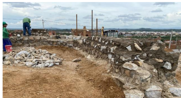
Construção dos muros de contenção (entre o platô 3 e 4)