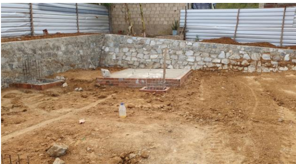
Base do Castelo d' água