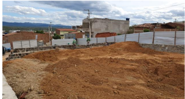
Aterro do Patrô - 2