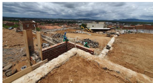
Aterro do Platô 2 e 4 e escada em alvenaria