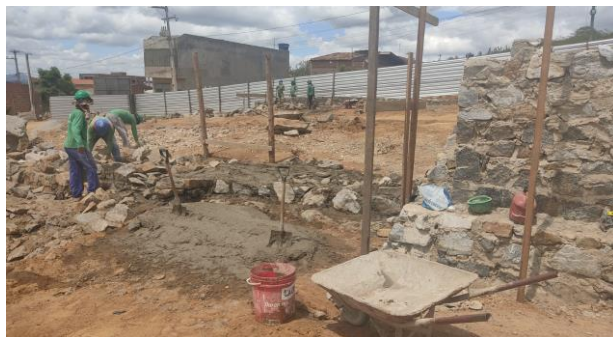
Construção dos muros de contenção (entre o platô 2 e 4)