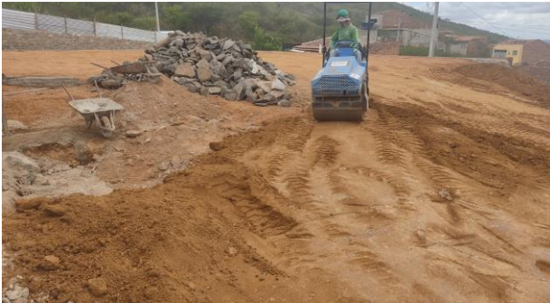
Aterro do Patrô - 4