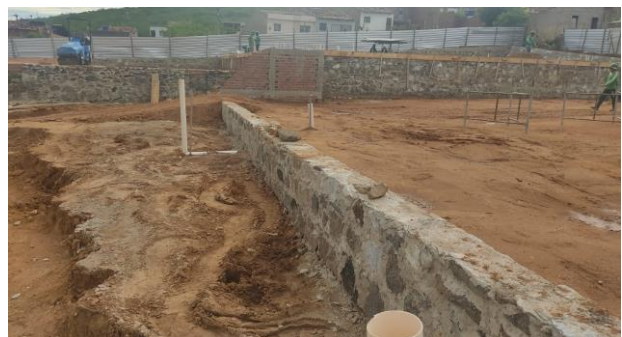
Construção dos muros de contenção (entre o platô 3 e 4)