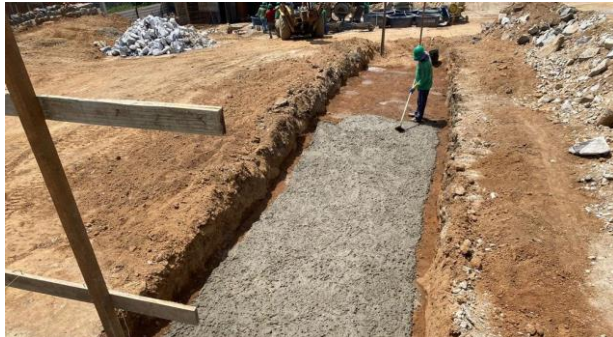
Concreto magro sobre escavação de valas em material de 3ª categoria p/ fundação dos muros de contenção.