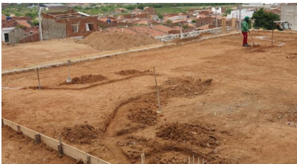
Gabarito da Creche II (Platô 1)