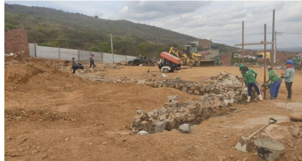
Escavação de valas em material de 3ª categoria p/ fundação dos muros de contenção.