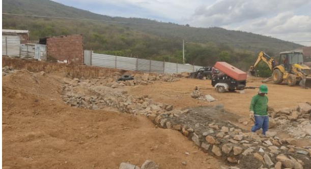
Escavação de valas em material de 3ª categoria p/ fundação dos muros de contenção.