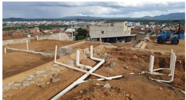
Instalações Sanitárias da Creche II