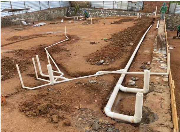
Instalações Sanitárias da Creche II