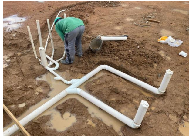
Instalações Sanitárias da Creche II