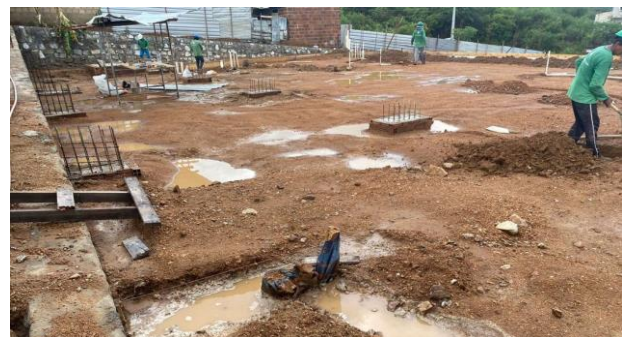
Sapatas/Pilaretes do Bloco C10