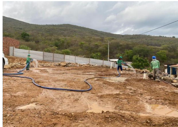
Aterro do Patrô - 3