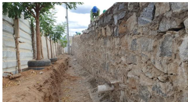
Construção do muro de contenção (Lado direito)