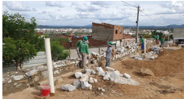
Construção do muro de contenção (Lado direito)