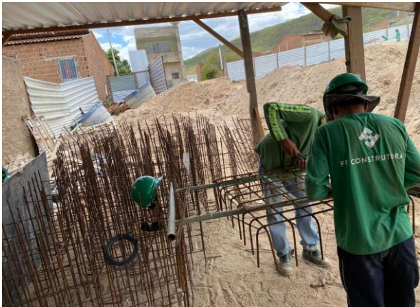
Armação das ferragens da fundação