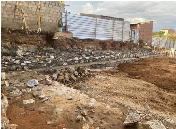
Construção do muro de contenção (Fundos)