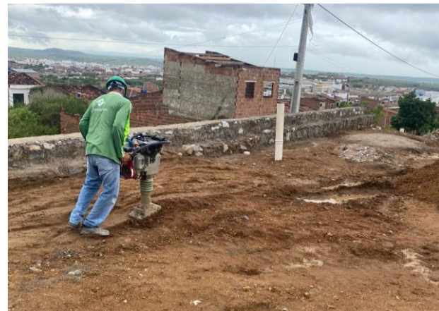
Aterro do Patrô - 3 (COMPACTAÇÃO PROXÍMO AOS MUROS, REALIZADAS C/ COMPACTADOR DE PERCUSSÃO E CENTRO DO PLATÔ C/ ROLO).