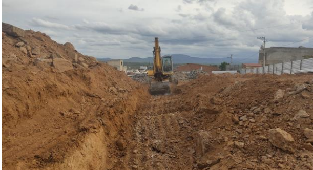
Escavação de valas em material de 3ª categoria p/ fundação dos muros de contenção.