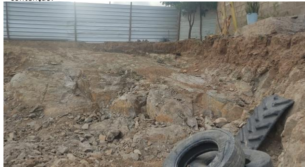
Escavação de valas em material de 3ª categoria p/ fundação dos muros de contenção.