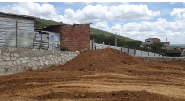
Aterro do Patrô - 1