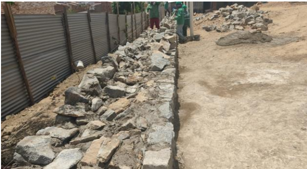
Construção do muro de contenção (Lado direito)