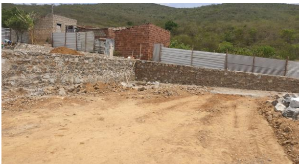
Construção do muro de contenção (Fundos/centro)