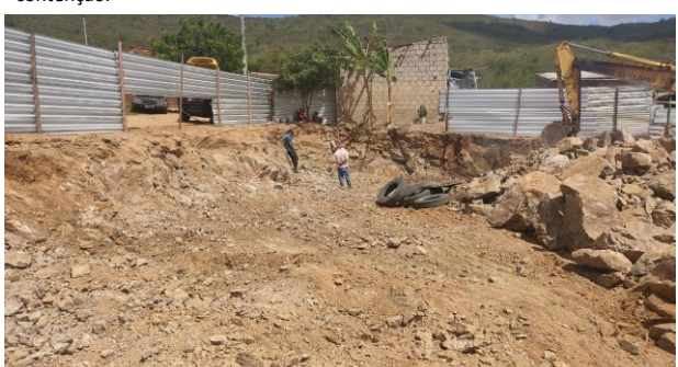
Escavação de valas em material de 3ª categoria p/ fundação dos muros de contenção.