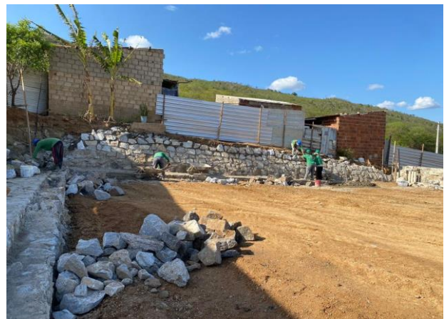
Construção do muro de contenção (Fundos/Lado esquerdo)