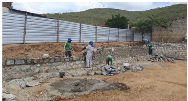
Construção do muro de contenção (Lado esquerdo/fundos)