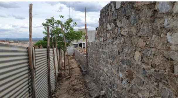
Construção do muro de contenção (Lado direito)