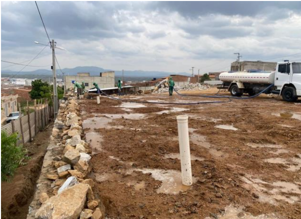
Aterro do Patrô - 3