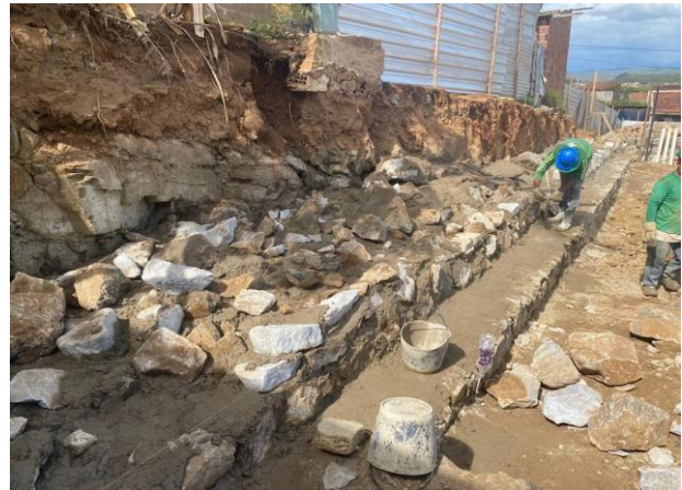
Construção do muro de contenção (Fundos)