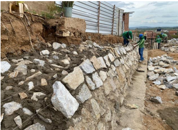
Construção do muro de contenção (Fundos)