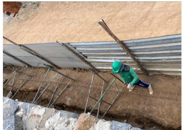
Armação das ferragens da fundação