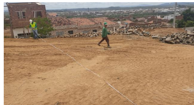
Aterro do Patrô - 3