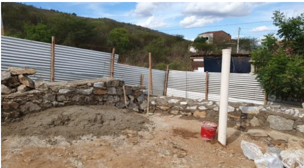
Construção do muro de contenção (Lado direito / Fundos)