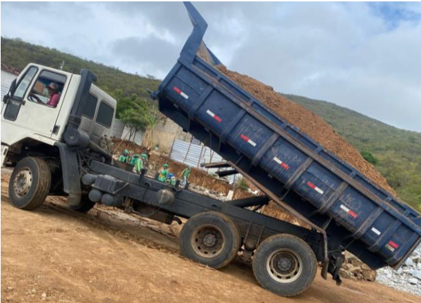
Aterro do Patrô - 3