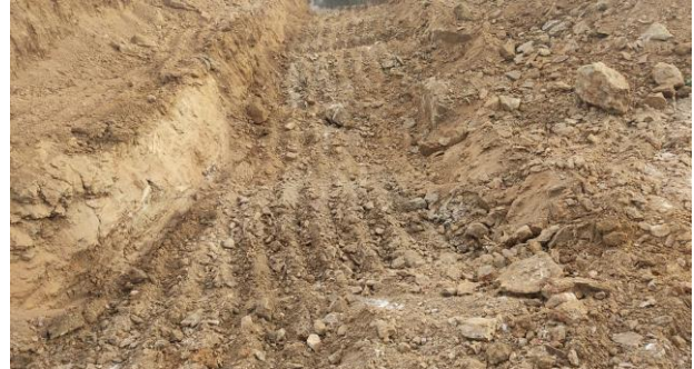
Escavação de valas em material de 3ª categoria p/ fundação dos muros de contenção.