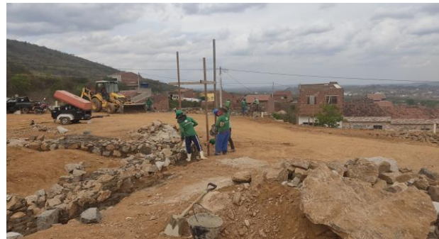
Construção do muro de contenção (Centro - contorno do plato-1)