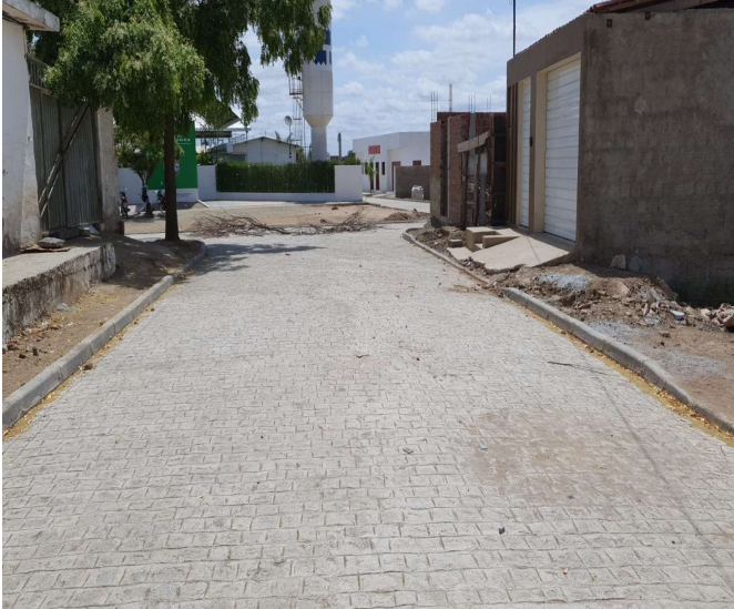
RUA PROJETADA 03 "S7Q51Q60" (trecho - 2)_"Rua Carpina"