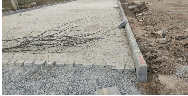
RUA PROJETADA NOVA 01, BAIRRO DEUS É FIEL