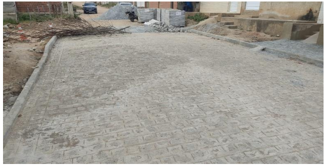
RUA JOSEFA JOANA DA SILVA, BAIRRO AREAL