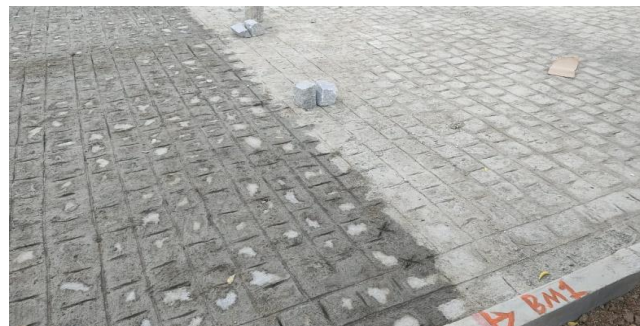
RUA MONTEIRO LOBATO, BAIRRO AREAL