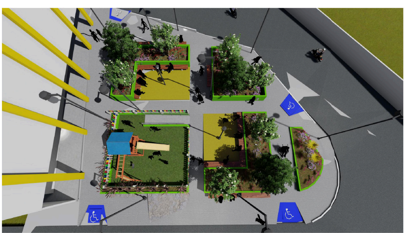
5 PERSPECTIVA 02 SEM ESCALA