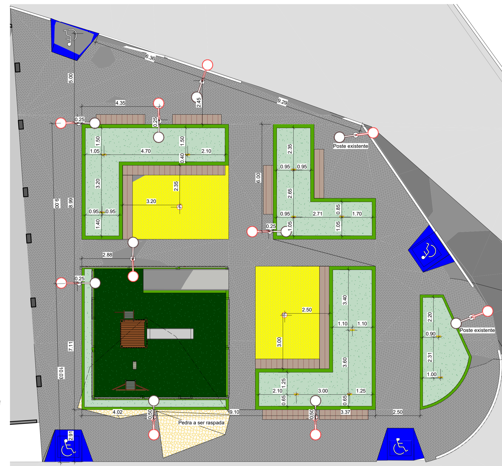
2 Planta de locação dos postes ESCALA 1:100