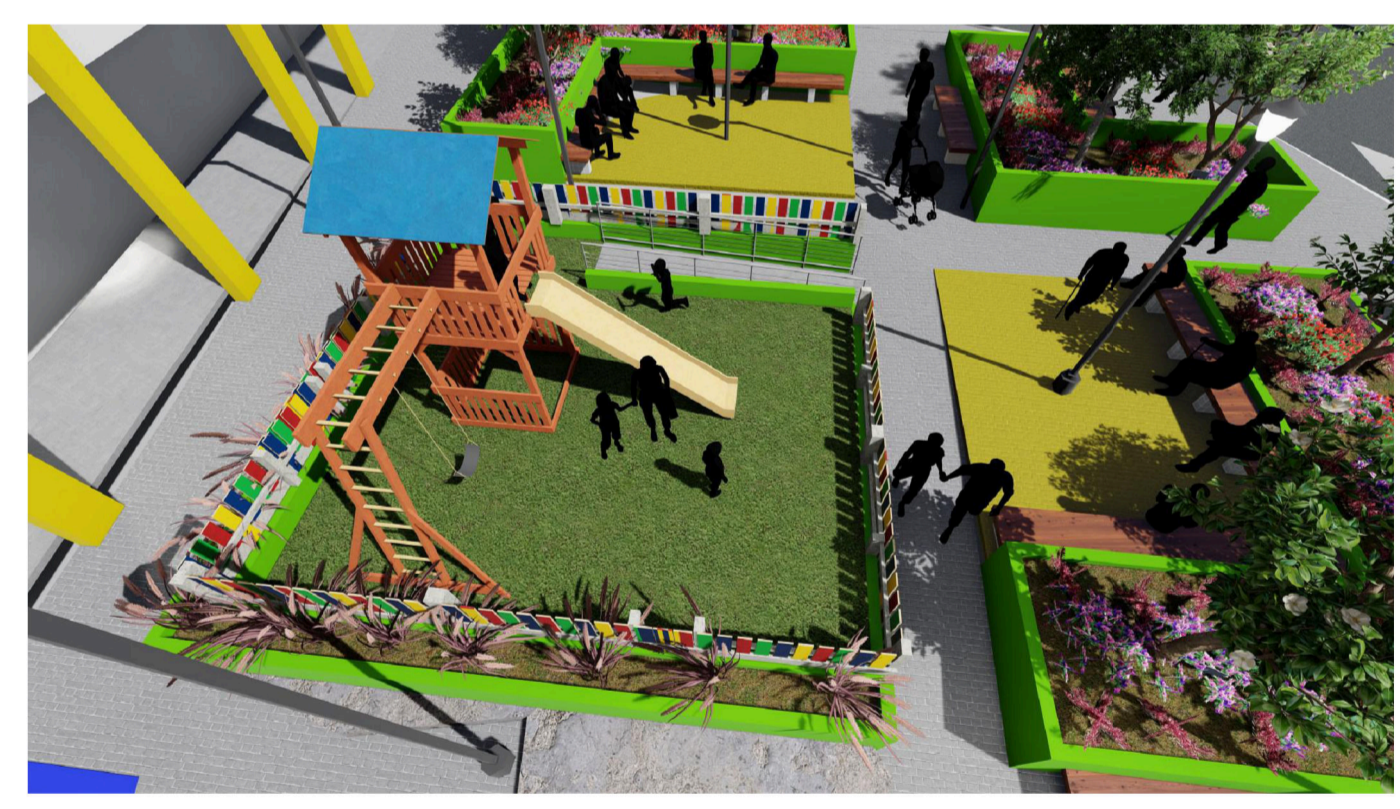
4 PERSPECTIVA 01 SEM ESCALA