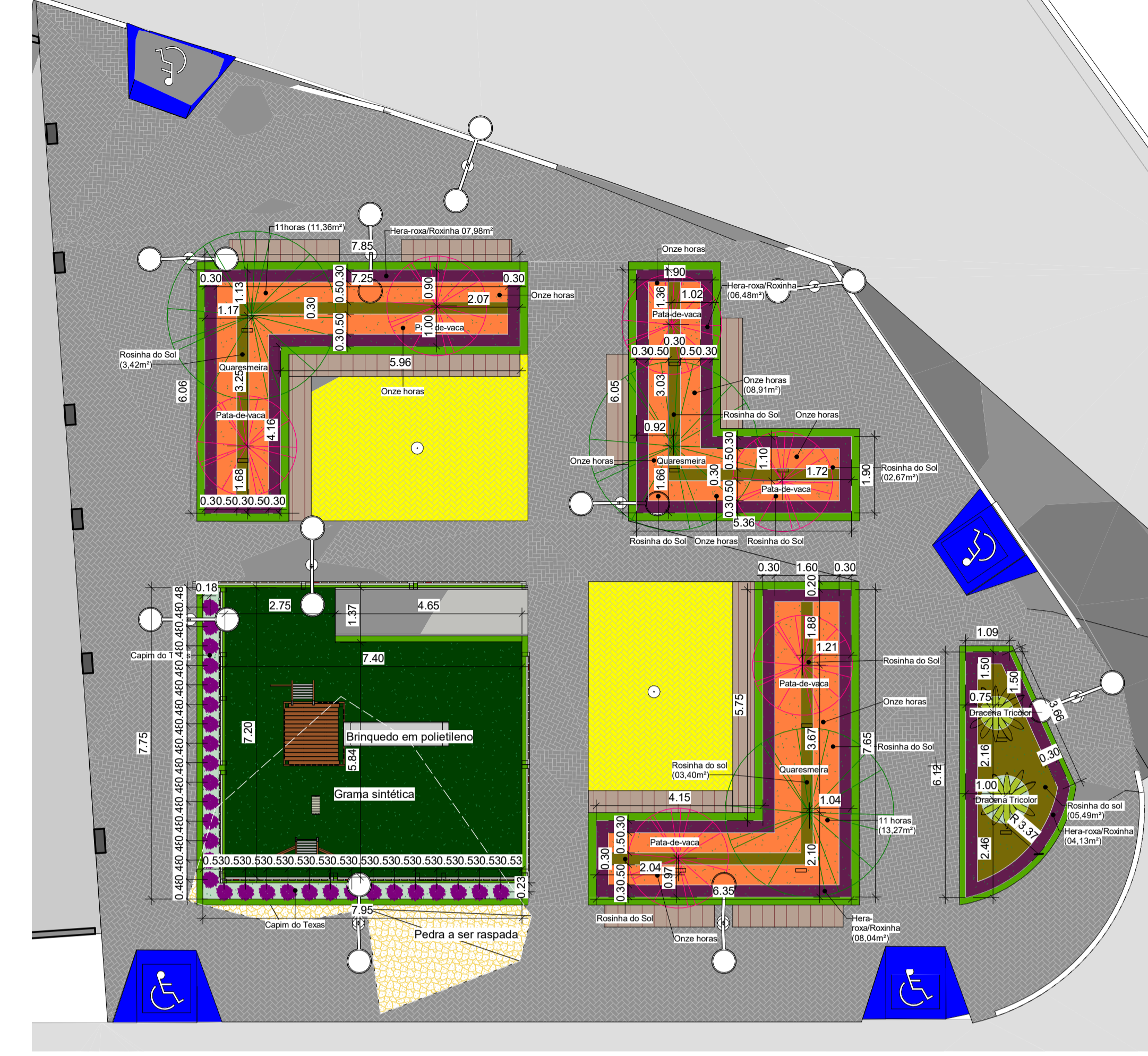
2 Planta de Cobertura Vegetal ESCALA 1:100