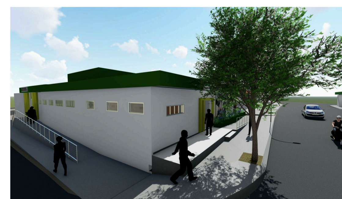
4 Imagem 07: Vista da esquina da edificação

DESCRIÇÃO: Projeto de reforma do antigo fórum para criação de um centro de inclusão e fortalecimento de vínculos e um centro de atendimento aos munícipes. Localizado na esquina da Rua João Chagas com a 2ª Travessa Enéas Vicente, Toritama-PE.