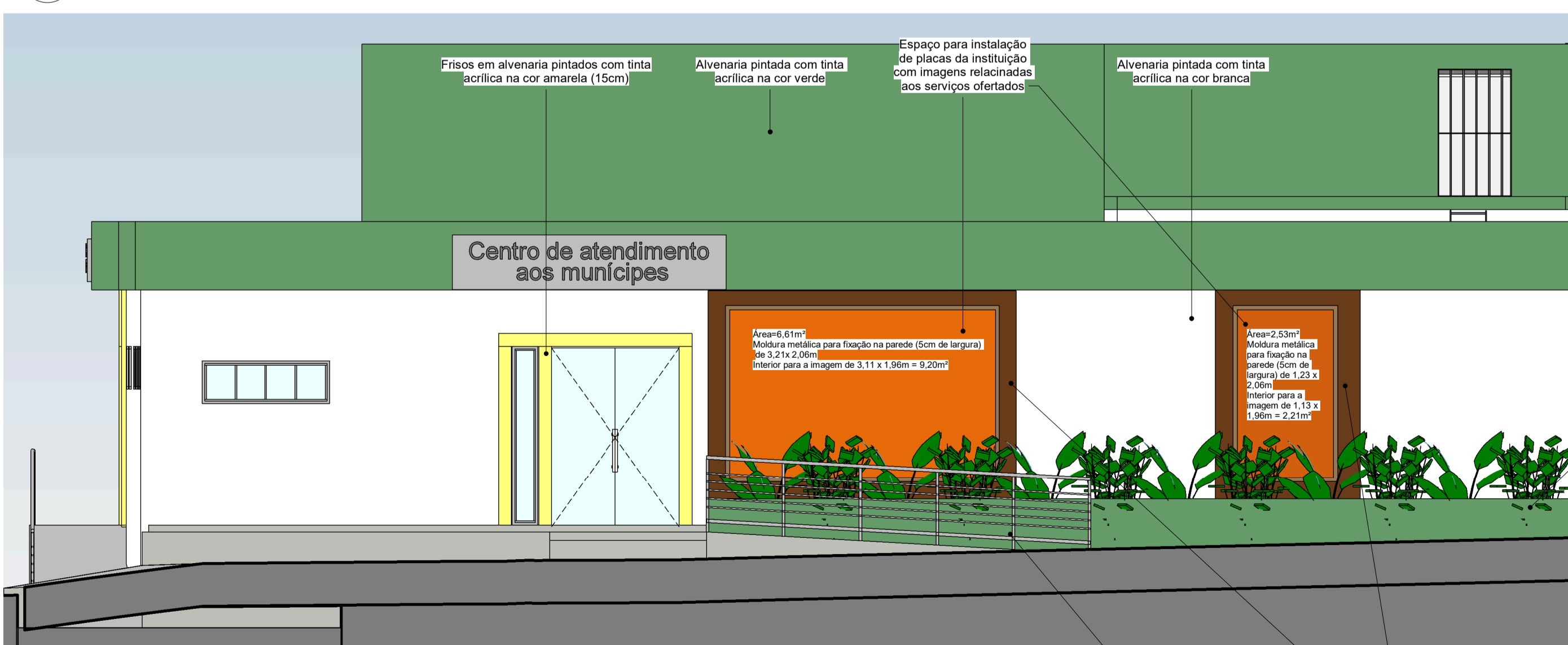
3 FACHADA SUL ESCALA 1:50