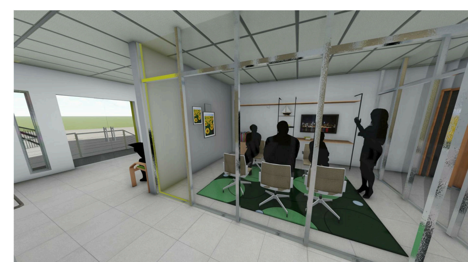
8 Imagem 06: Vista interna do Centro de Fortalecimento de Vínculos