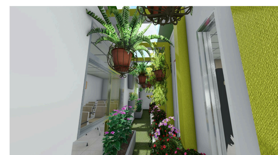
7 Imagem 05: Jardim