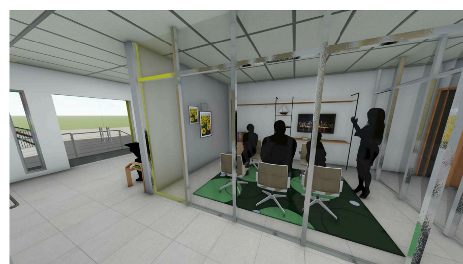
4 Imagem 02: Vista interna do Centro de Fortalecimento de Vínculos