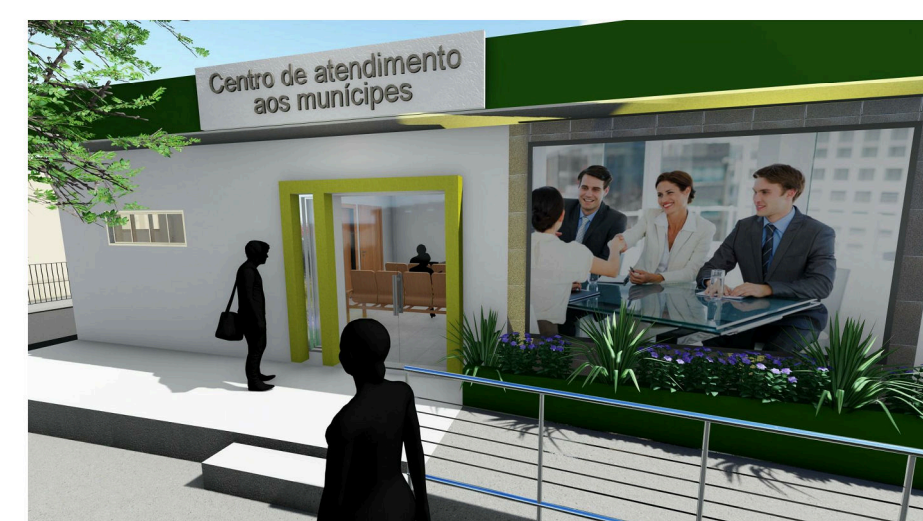
3 Imagem 01: Acesso Fachada Sul