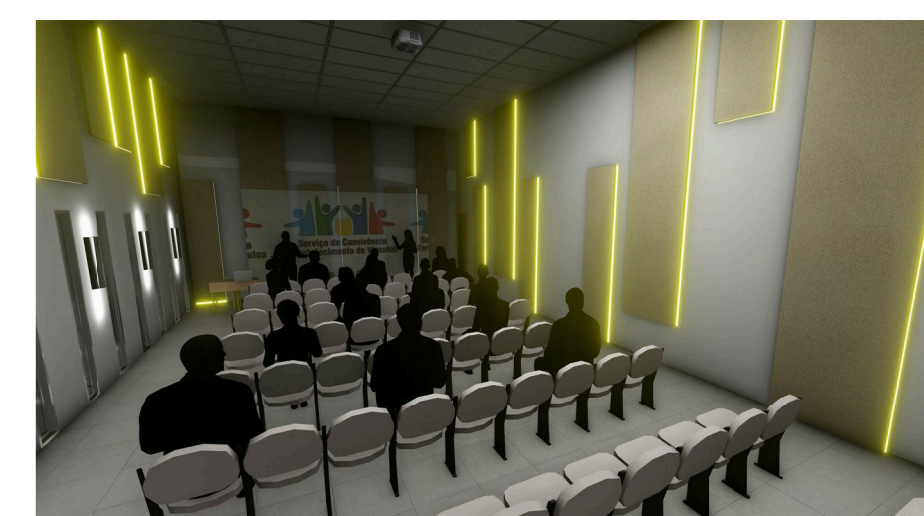
5 Imagem 03: Auditório