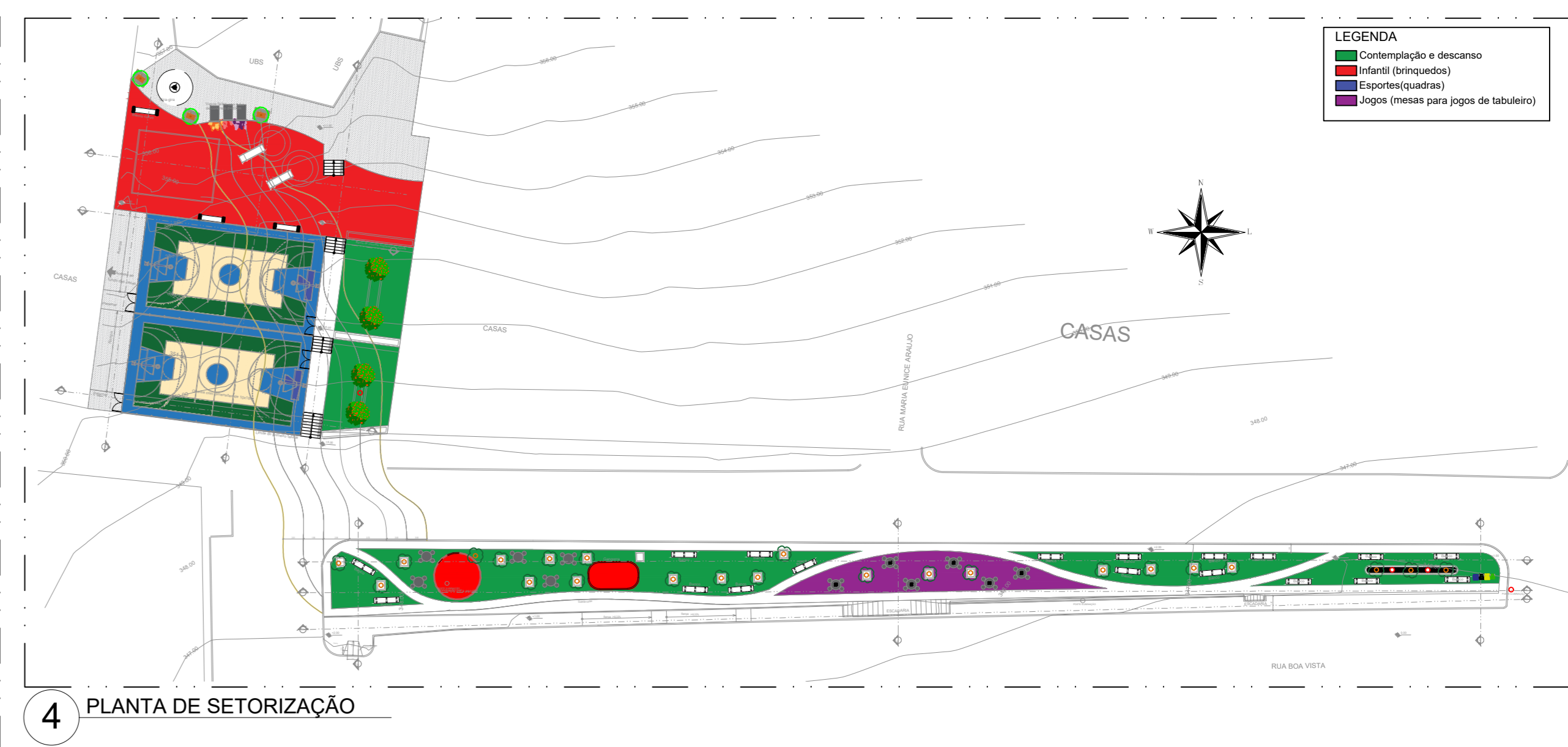
4 PLANTA DE SETORIZAÇÃO

DESCRIÇÃO Projeto urbanístico de requalificação para praça localizada na Rua Boa Vista popularmente conhecida como "Praça de Fazenda Velha" e criação de área lazer / esportes na área pública ao lado da UBS, no município de Toritama - PE.