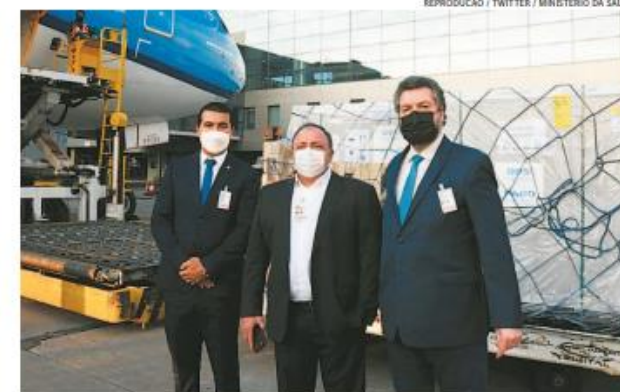
Até o maio, o país deve receber um total de 9,1 milhões de doses deste imunizante

A entrega é parte de uma primeira fase de distribuição de doses da OMS para o Brasil. O país recebeu hoje 1.022.400 de doses desse imunizante. Segundo o Ministério da Saúde, até o final deste mês de março serão entregues mais 1,9 milhão de doses do mesmo fabricante por meio dessa aliança global, que conta com a participação de mais de 150 países.